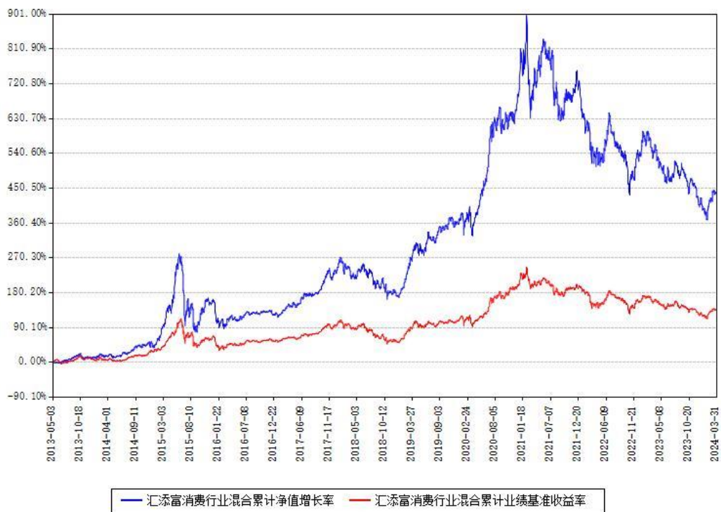
汇添富消费行业混合累计净值增长率与同期业绩基准收益率对比图