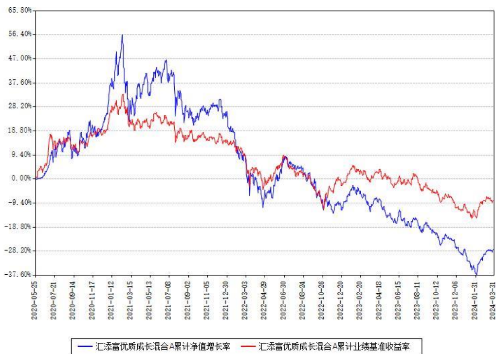
汇添富优质成长混合A累计净值增长率与同期业绩基准收益率对比图

(二)自基金合同生效以来基金累计净值增长率变动及其与同期业绩比较基准收益率变动的比较