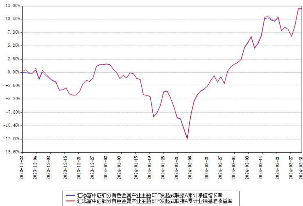
汇添富中证细分有色金属产业主题ETF发起式联接A累计净值增长率与同期业绩基准收益率对比图