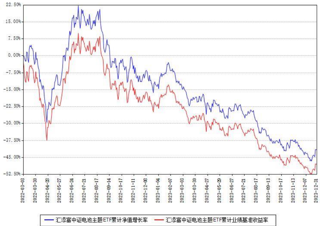
汇添富中证电池主题ETF累计净值增长率与同期业绩基准收益率对比图