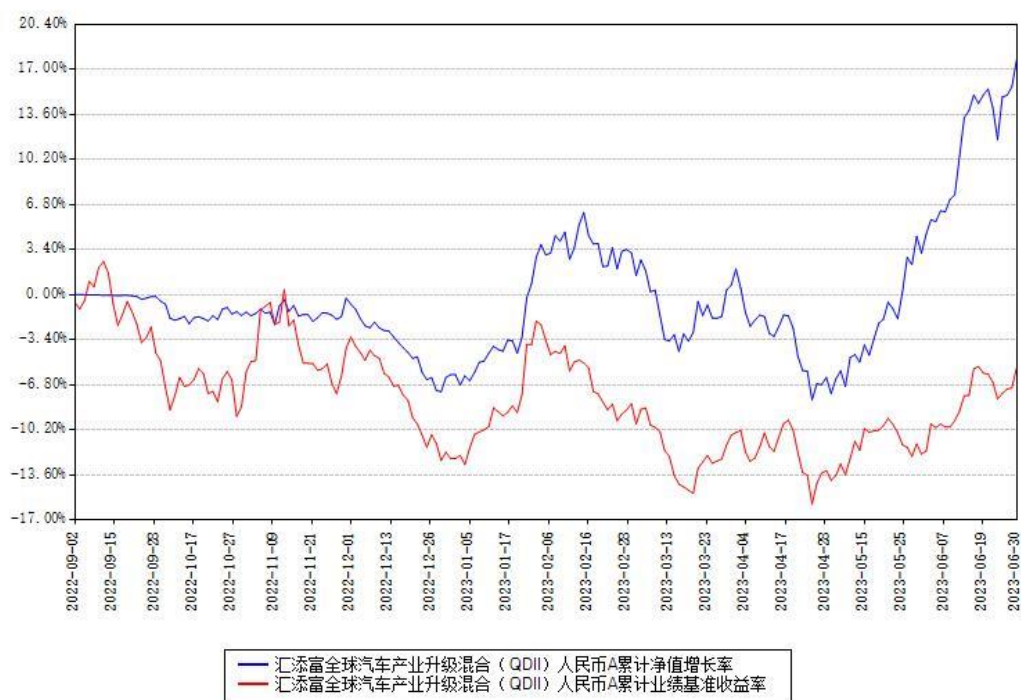
汇添富全球汽车产业升级混合（QDII）人民币A累计净值增长率与同期业绩基准收益率对比图

（二）自基金合同生效以来基金份额累计净值增长率变动及其与同期业绩比较基准收益率变动的比较