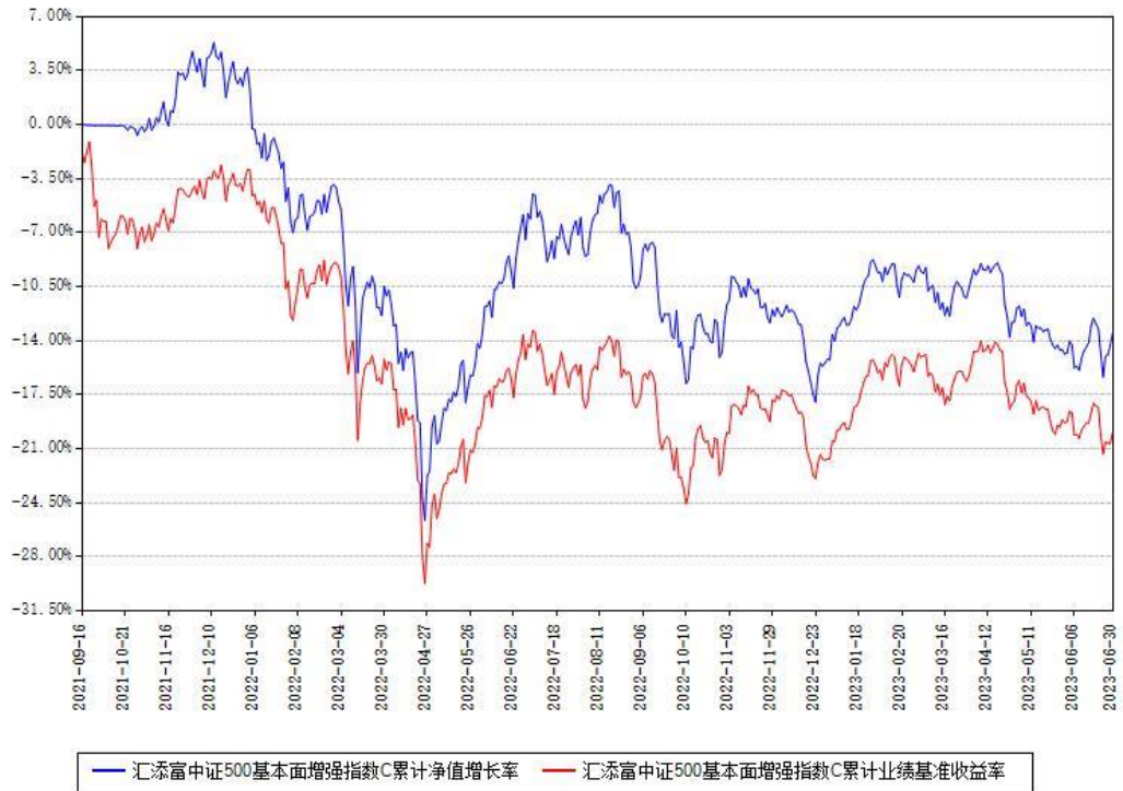
汇添富中证500基本面增强指数C累计净值增长率与同期业绩基准收益率对比图