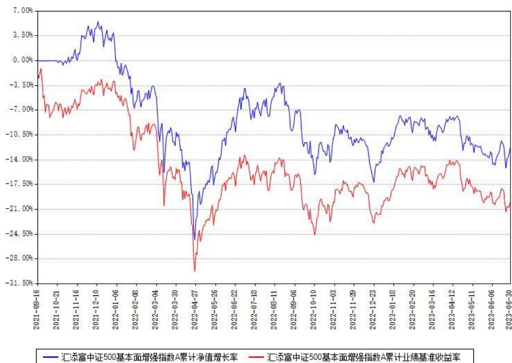
汇添富中证500基本面增强指数A累计净值增长率与同期业绩基准收益率对比图