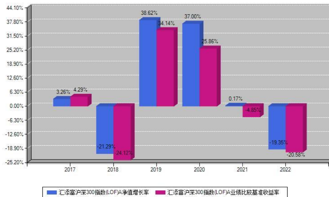
汇添富沪深300指数(LOF)A每年净值增长率与同期业绩基准收益率对比图

注：数据截止日期为2022年12月31日，基金的过往业绩不代表未来表现。本《基金合同》生效之日为2017年09月06日，合同生效当年按实际存续期计算，不按整个自然年度进行折算。