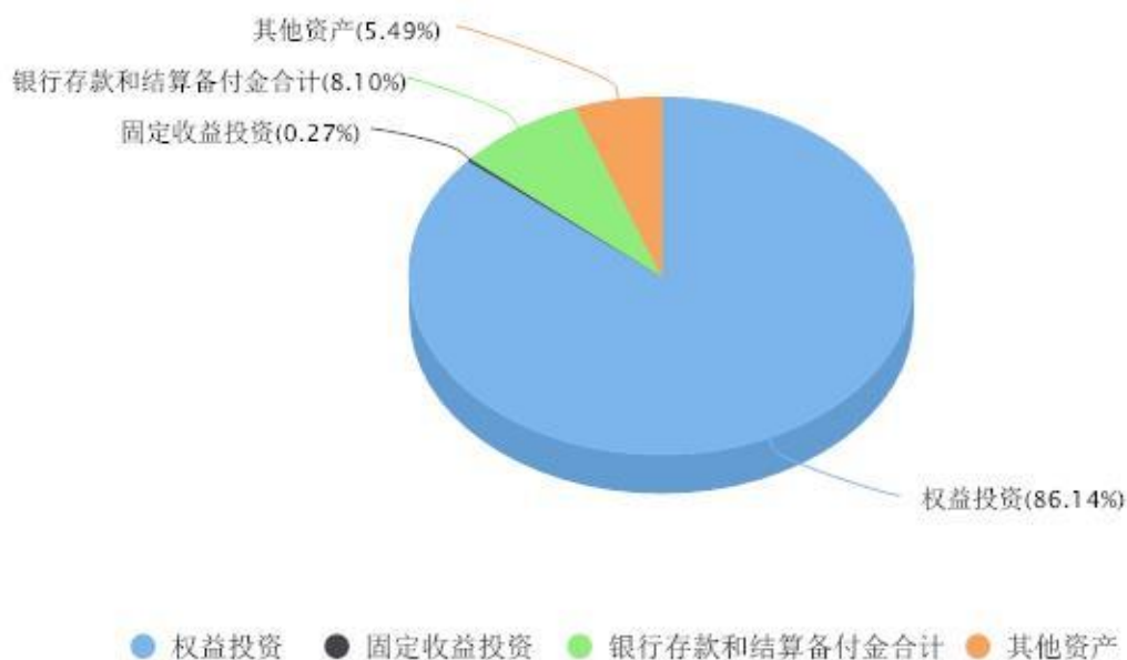
投资组合资产配置图表 数据截止日期:2023年06月30日