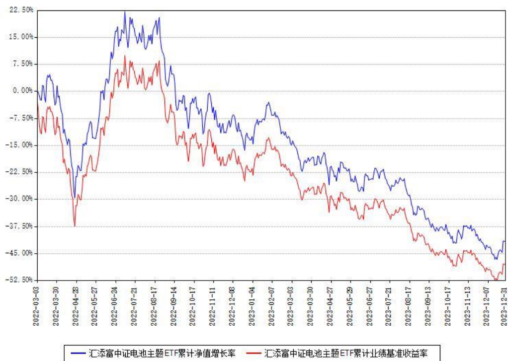
汇添富中证电池主题ETF累计净值增长率与同期业绩基准收益率对比图