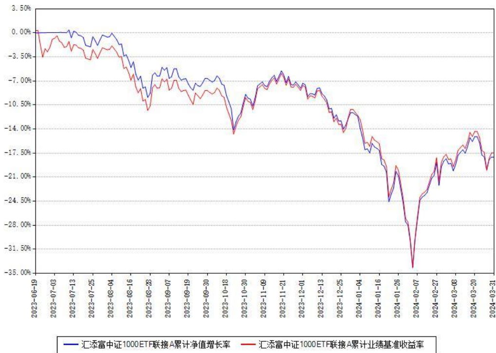
汇添富中证1000ETF联接A累计净值增长率与同期业绩基准收益率对比图