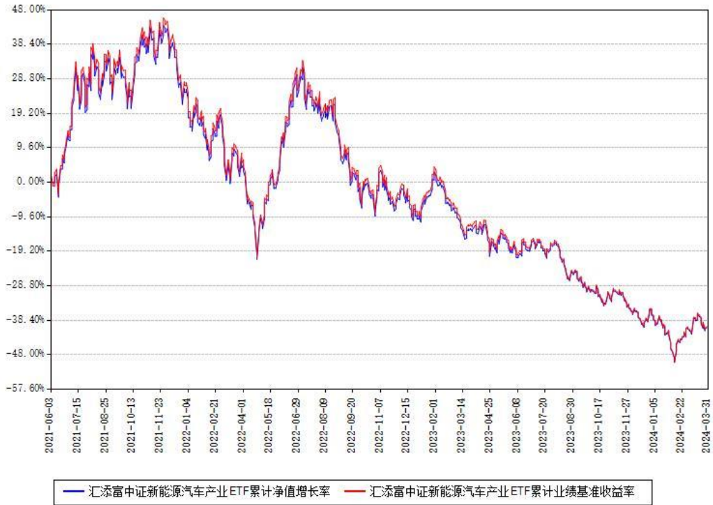
汇添富中证新能源汽车产业ETF累计净值增长率与同期业绩基准收益率对比图