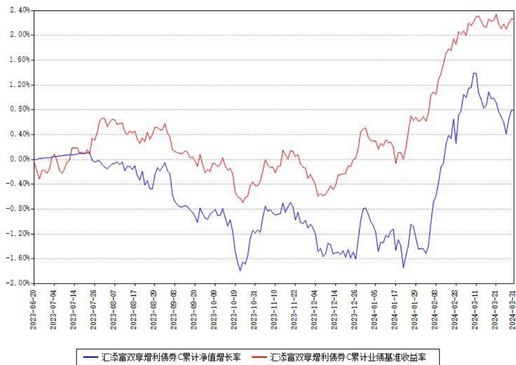
汇添富双享增利债券C累计净值增长率与同期业绩基准收益率对比图