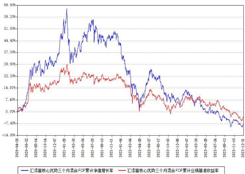
汇添富核心优势三个月混合FOF累计净值增长率与同期业绩基准收益率对比图