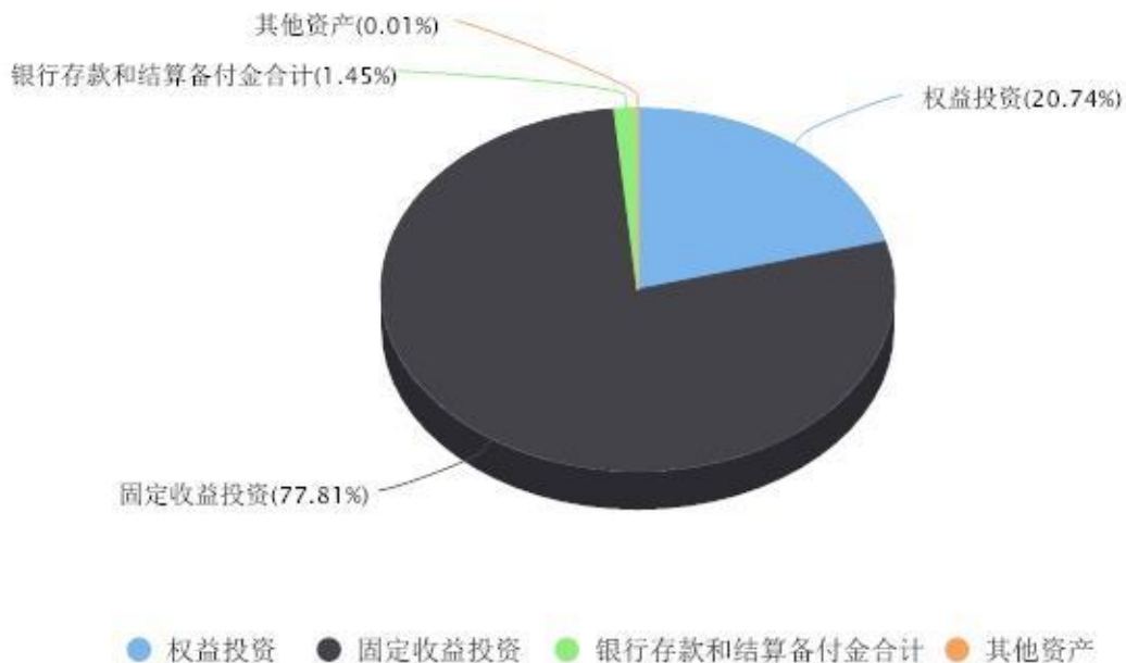
投资组合资产配置图表 数据截止日期:2023年12月31日