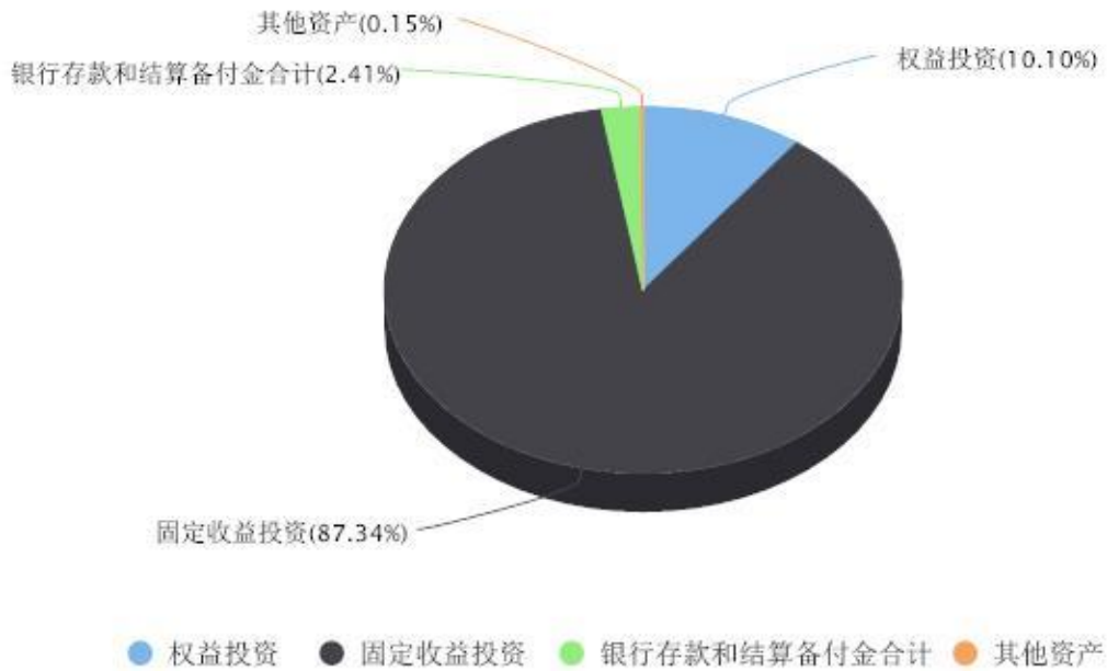
投资组合资产配置图表 数据截止日期:2024年03月31日