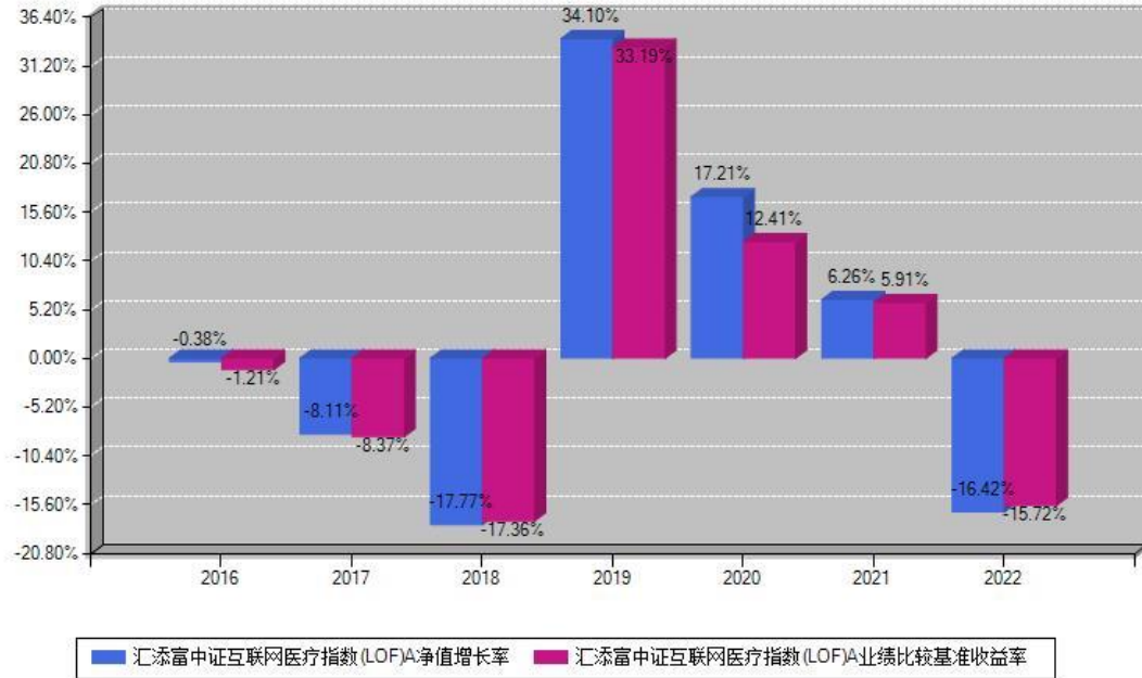
汇添富中证互联网医疗指数(LOF)A每年净值增长率与同期业绩基准收益率对比图

注：数据截止日期为2022年12月31日，基金的过往业绩不代表未来表现。本《基金合同》生效之日为2016年12月22日，合同生效当年按实际存续期计算，不按整个自然年度进行折算。