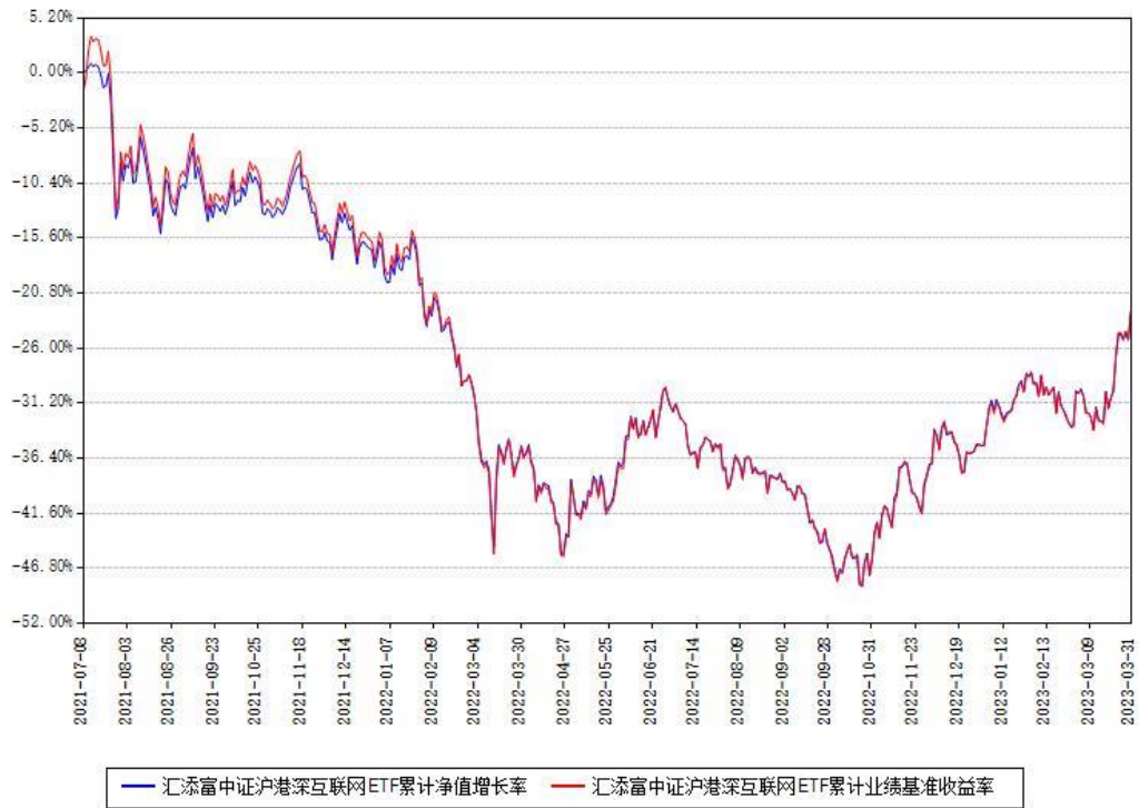
汇添富中证沪港深互联网ETF累计净值增长率与同期业绩基准收益率对比图