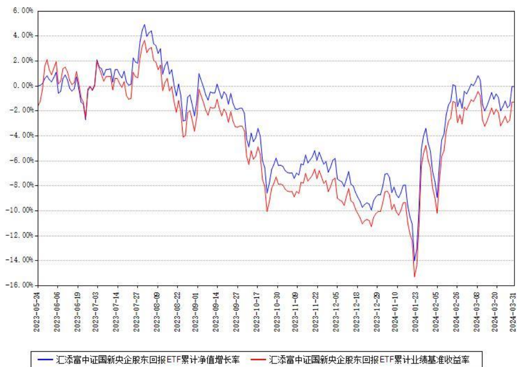
汇添富中证国新央企股东回报ETF累计净值增长率与同期业绩基准收益率对比图