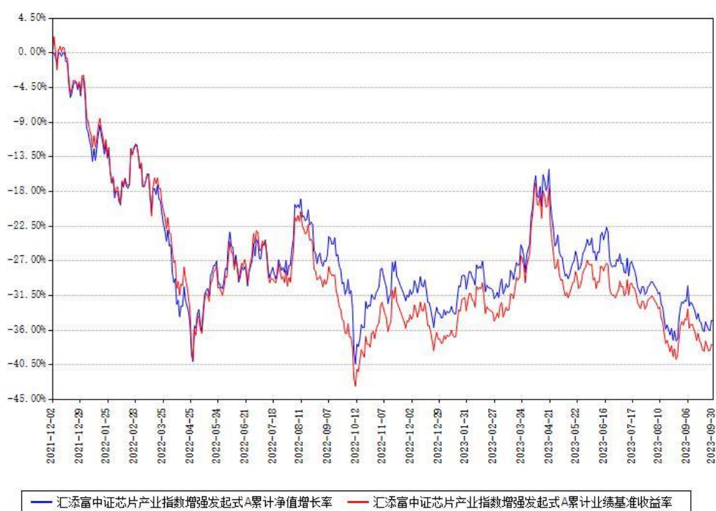
汇添富中证芯片产业指数增强发起式A累计净值增长率与同期业绩基准收益率对比图