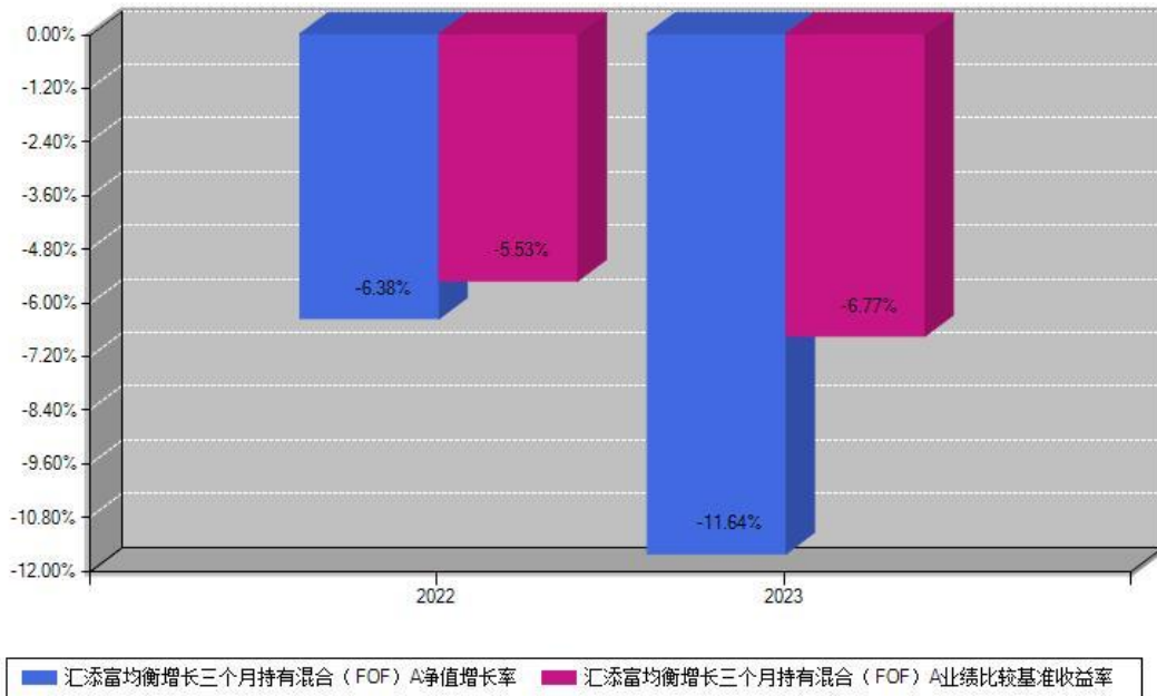
汇添富均衡增长三个月持有混合 (FOF) A 每年净值增长率与同期业绩基准收益率对比图

注: 数据截止日期为2023年12月31日, 基金的过往业绩不代表未来表现。本《基金合同》生效之日为2022年07月19日, 合同生效当年按实际存续期计算, 不按整个自然年度进行折算。