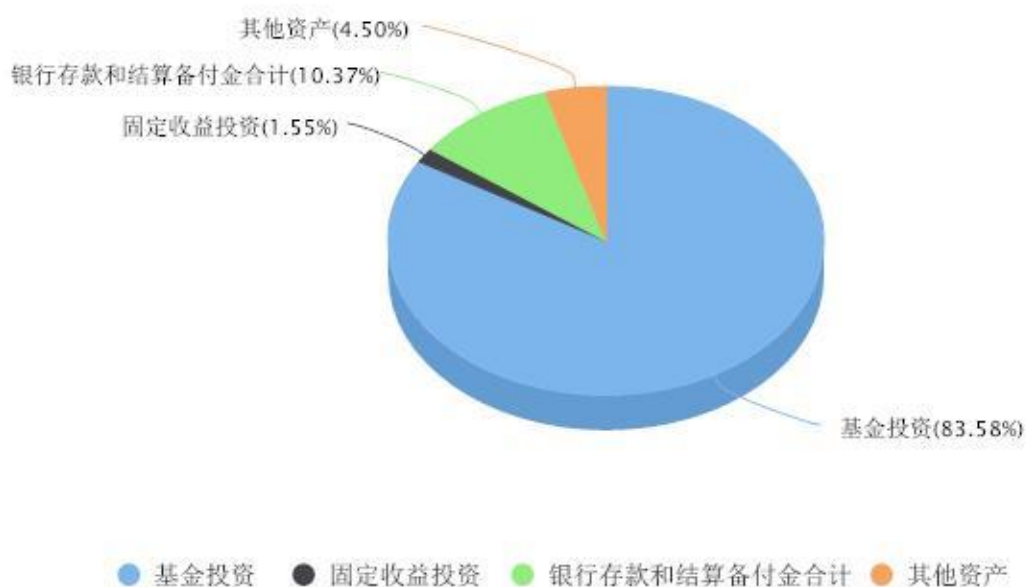
投资组合资产配置图表 数据截止日期:2024年03月31日