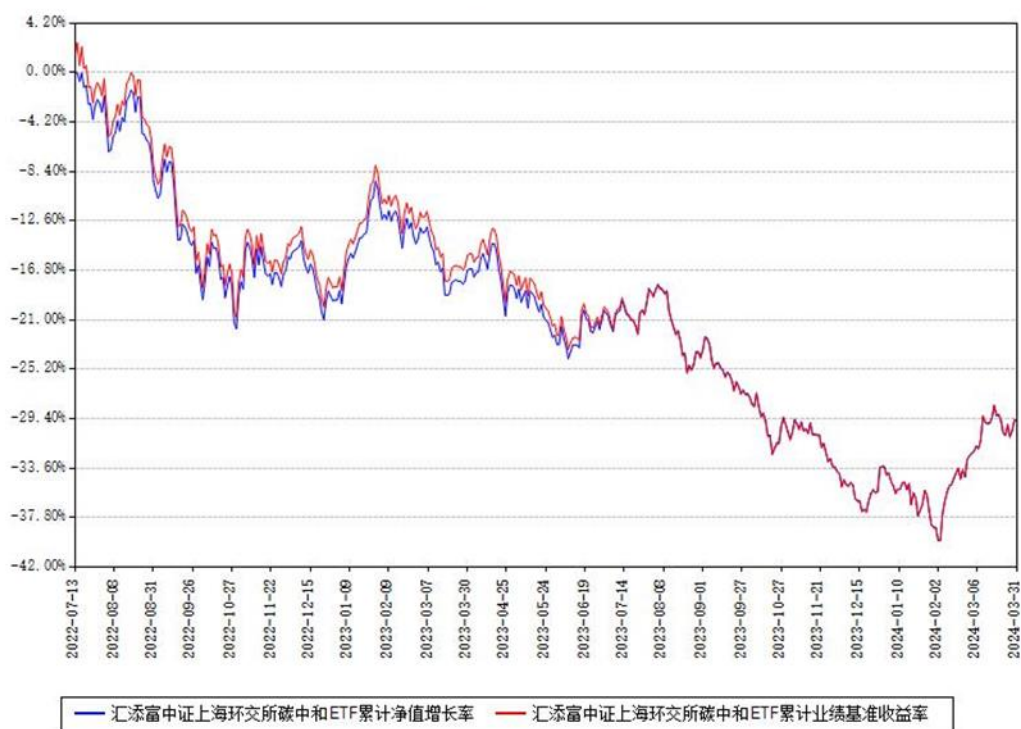
汇添富中证上海环交所碳中和ETF累计净值增长率与同期业绩基准收益率对比图

(二) 自基金合同生效以来基金累计净值增长率变动及其与同期业绩比较基准收益率变动的比较图