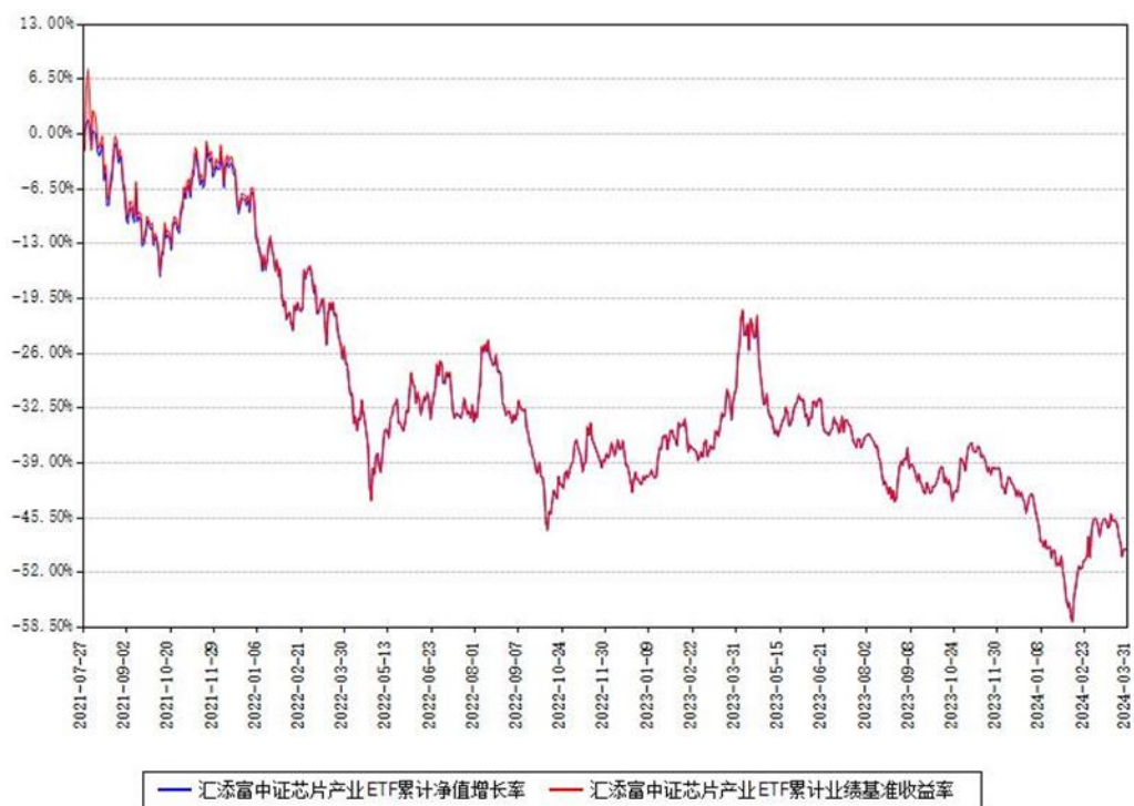
汇添富中证芯片产业ETF累计净值增长率与同期业绩基准收益率对比图