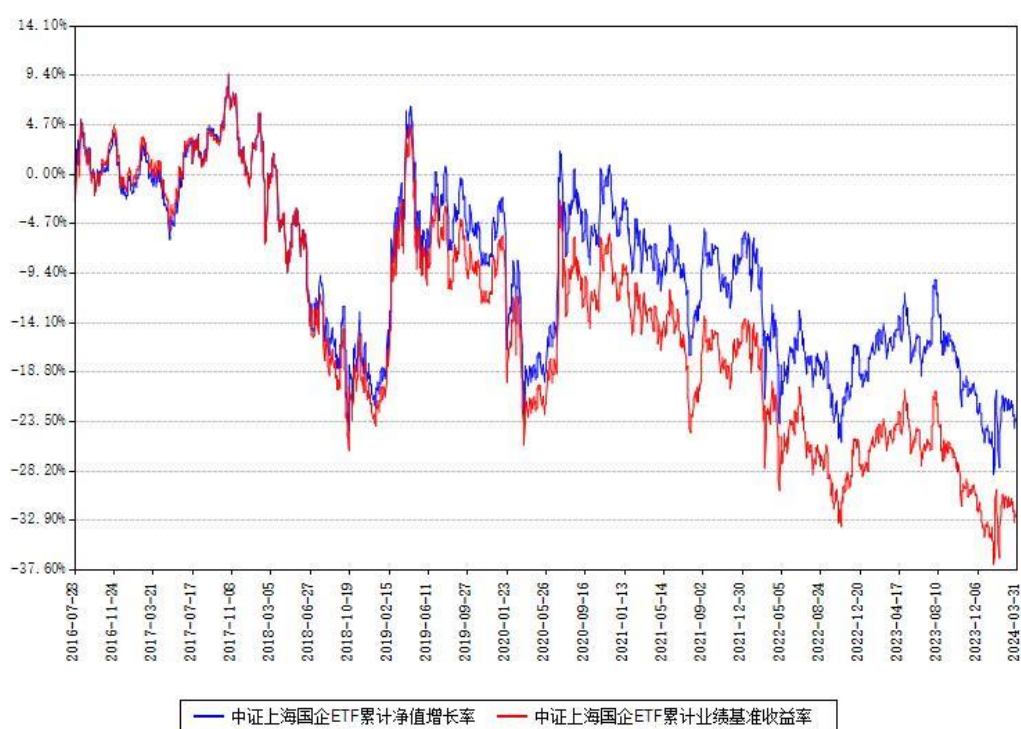
中证上海国企ETF累计净值增长率与同期业绩基准收益率对比图