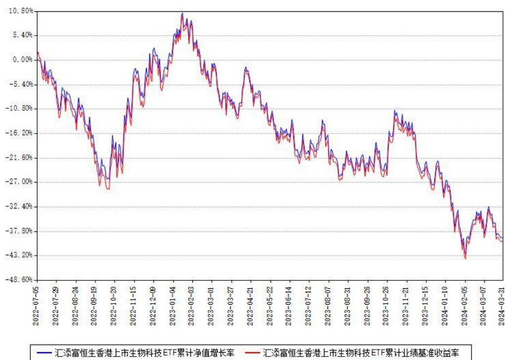
汇添富恒生香港上市生物科技ETF累计净值增长率与同期业绩基准收益率对比图