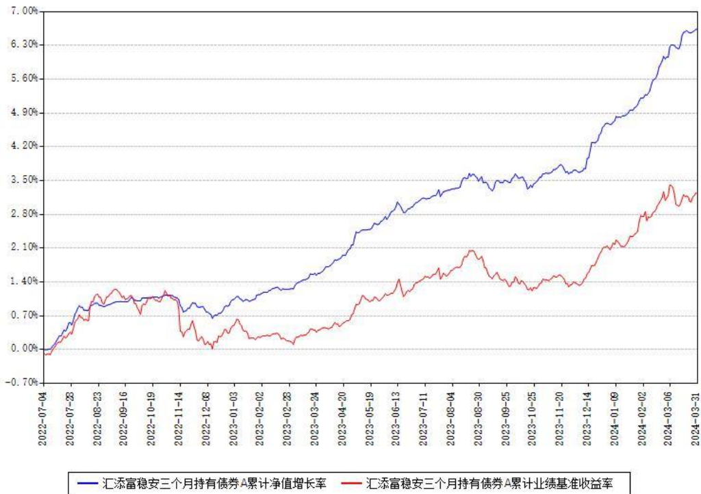
汇添富稳安三个月持有债券A累计净值增长率与同期业绩基准收益率对比图

（二）自基金合同生效以来基金累计净值增长率变动及其与同期业绩比较基准收益率变动的比较图