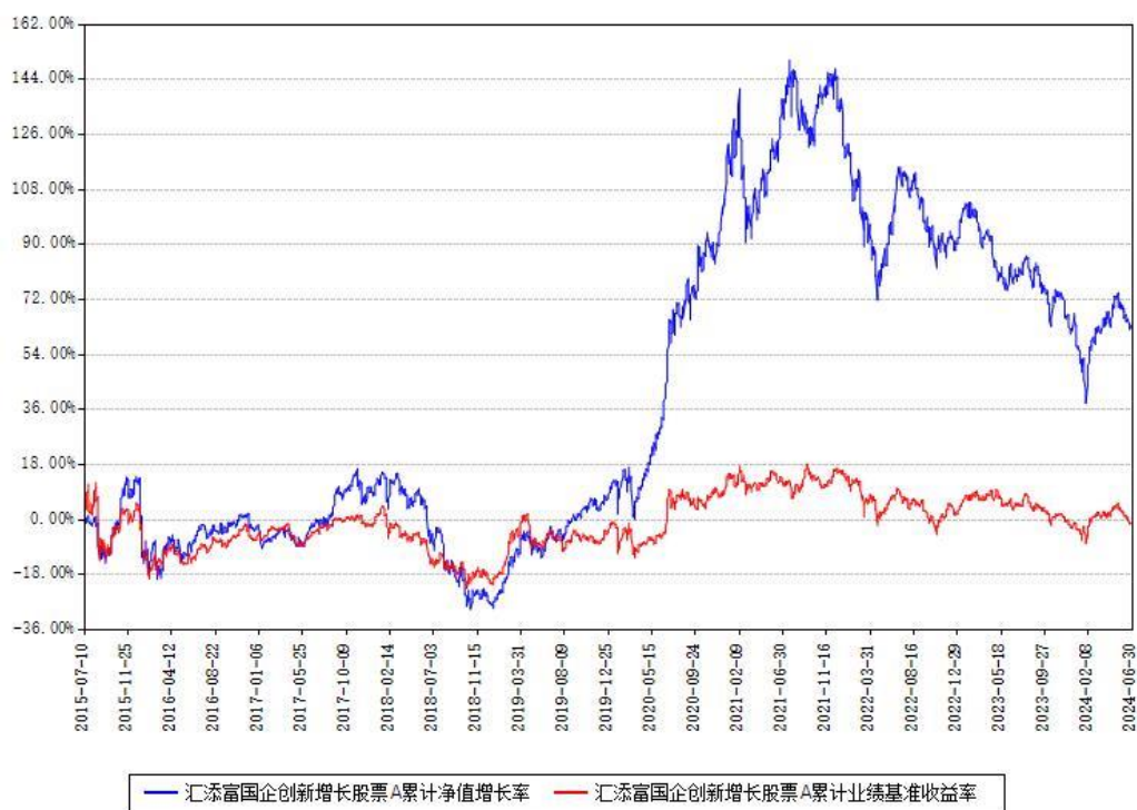
汇添富国企创新增长股票A累计净值增长率与同期业绩比较基准收益率对比图