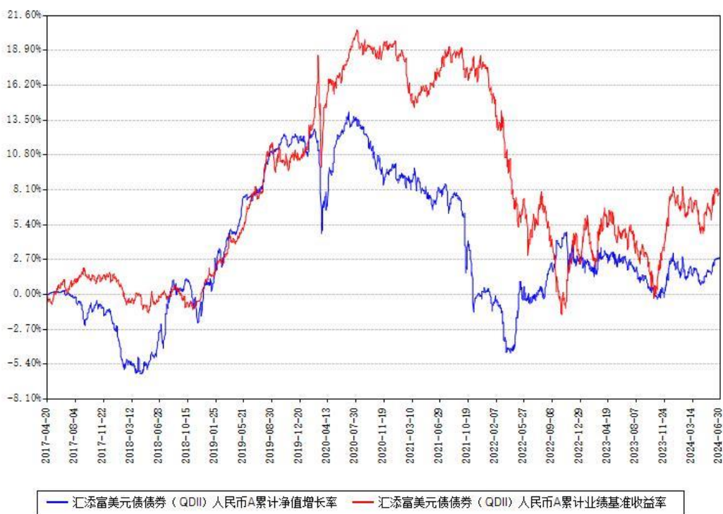
汇添富美元债债券（QDII）人民币C累计净值增长率与同期业绩基准收益率对比图