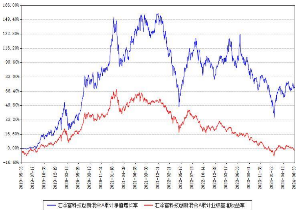
汇添富科技创新混合A累计净值增长率与同期业绩基准收益率对比图