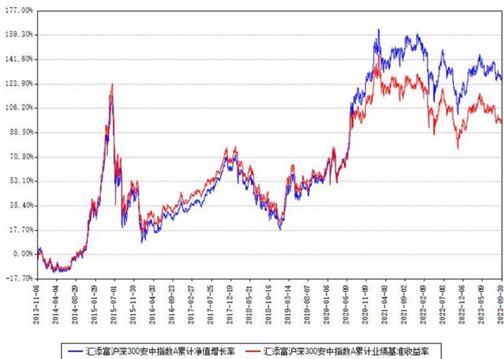
汇添富沪深300安中指数A累计净值增长率与同期业绩基准收益率对比图