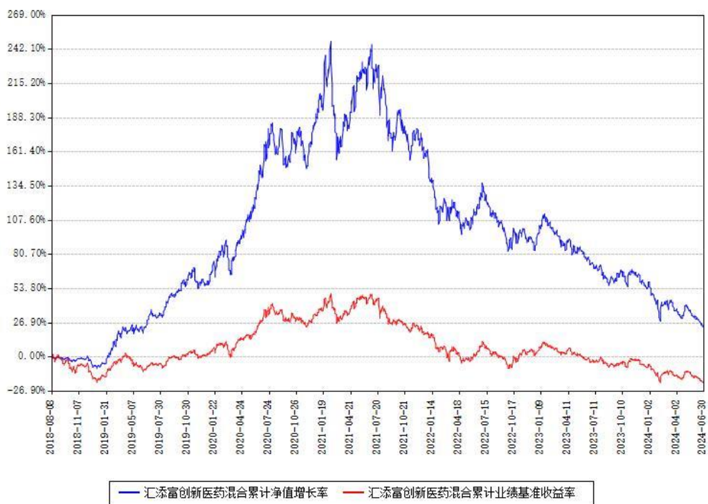
汇添富创新医药混合累计净值增长率与同期业绩基准收益率对比图