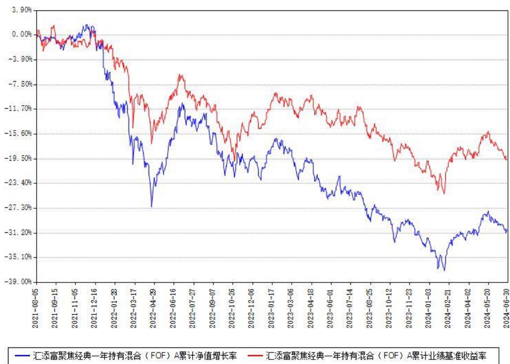
汇添富聚焦经典一年持有混合（FOF）A累计净值增长率与同期业绩基准收益率对比图

（二）自基金合同生效以来基金累计净值增长率变动及其与同期业绩比较基准收益率变动的比较图