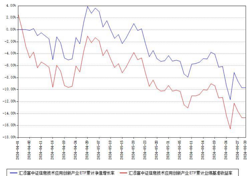
汇添富中证信息技术应用创新产业ETF累计净值增长率与同期业绩基准收益率对比图

(二) 自基金合同生效以来基金累计净值增长率变动及其与同期业绩比较基准收益率变动的比较图