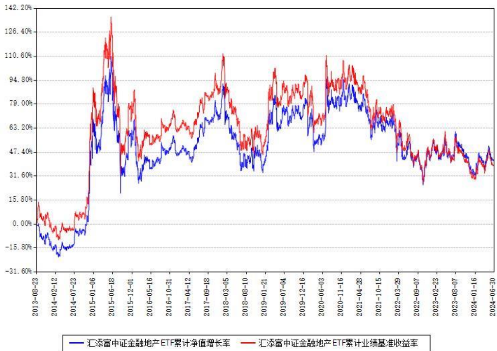
汇添富中证金融地产ETF累计净值增长率与同期业绩基准收益率对比图