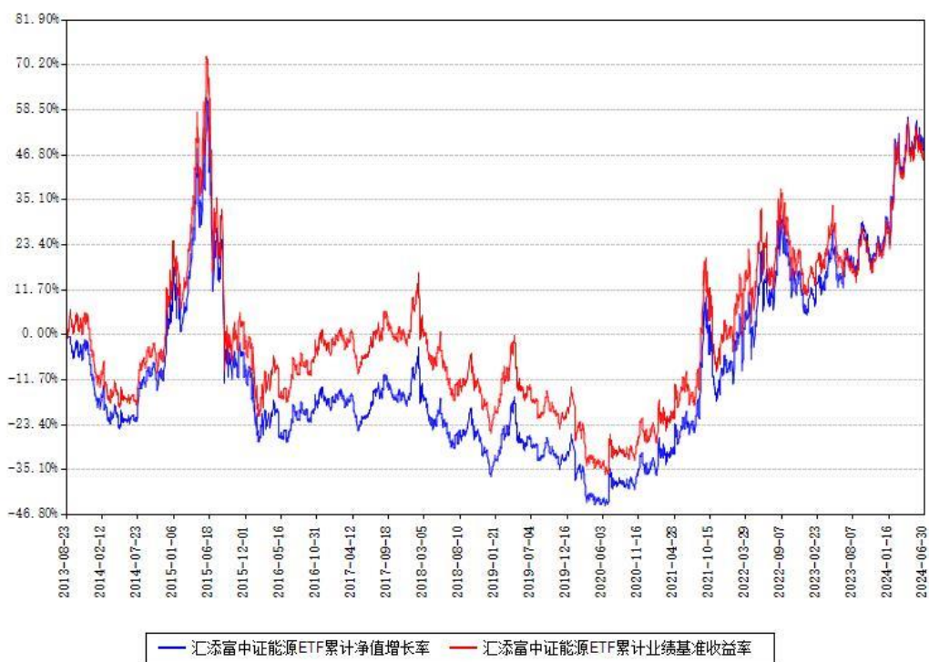
汇添富中证能源ETF累计净值增长率与同期业绩基准收益率对比图