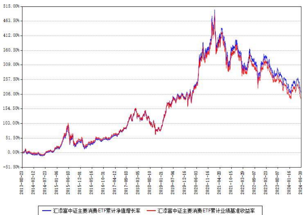
汇添富中证主要消费ETF累计净值增长率与同期业绩基准收益率对比图