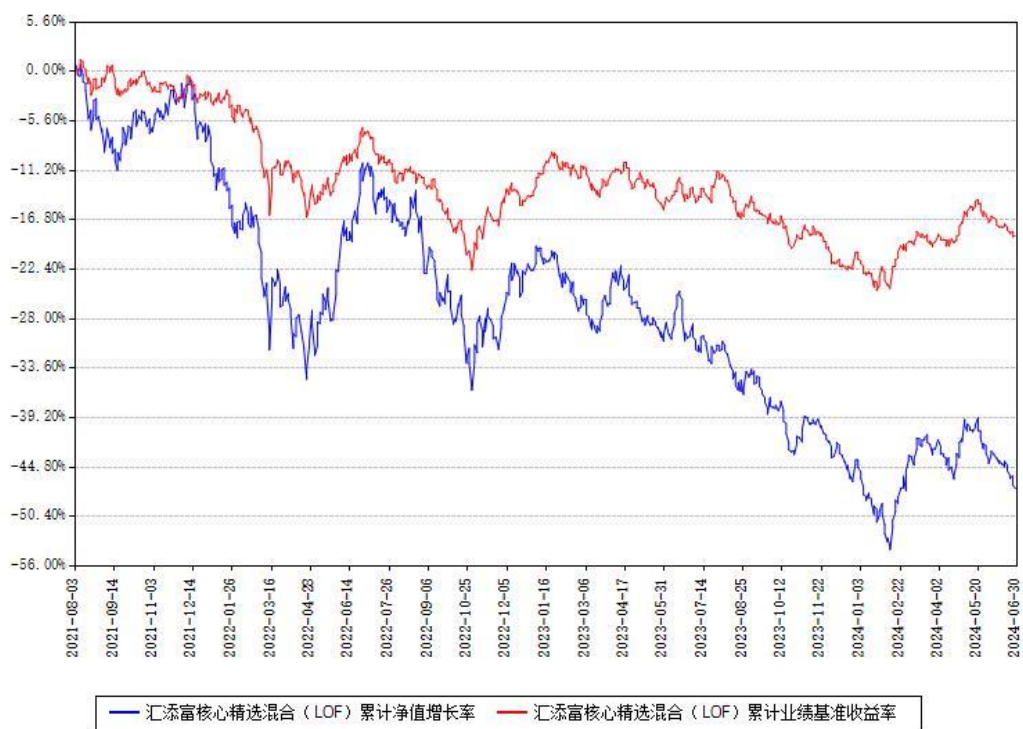
汇添富核心精选混合（LOF）累计净值增长率与同期业绩基准收益率对比图