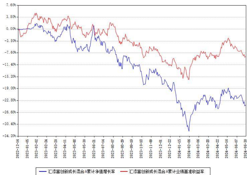
汇添富创新成长混合A累计净值增长率与同期业绩基准收益率对比图