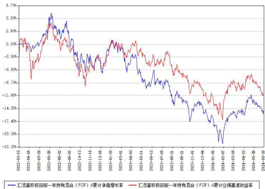
汇添富积极回报一年持有混合（FOF）A累计净值增长率与同期业绩比较基准收益率对比图