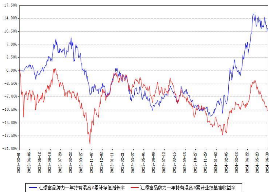
汇添富品牌力一年持有混合A累计净值增长率与同期业绩比较基准收益率对比图