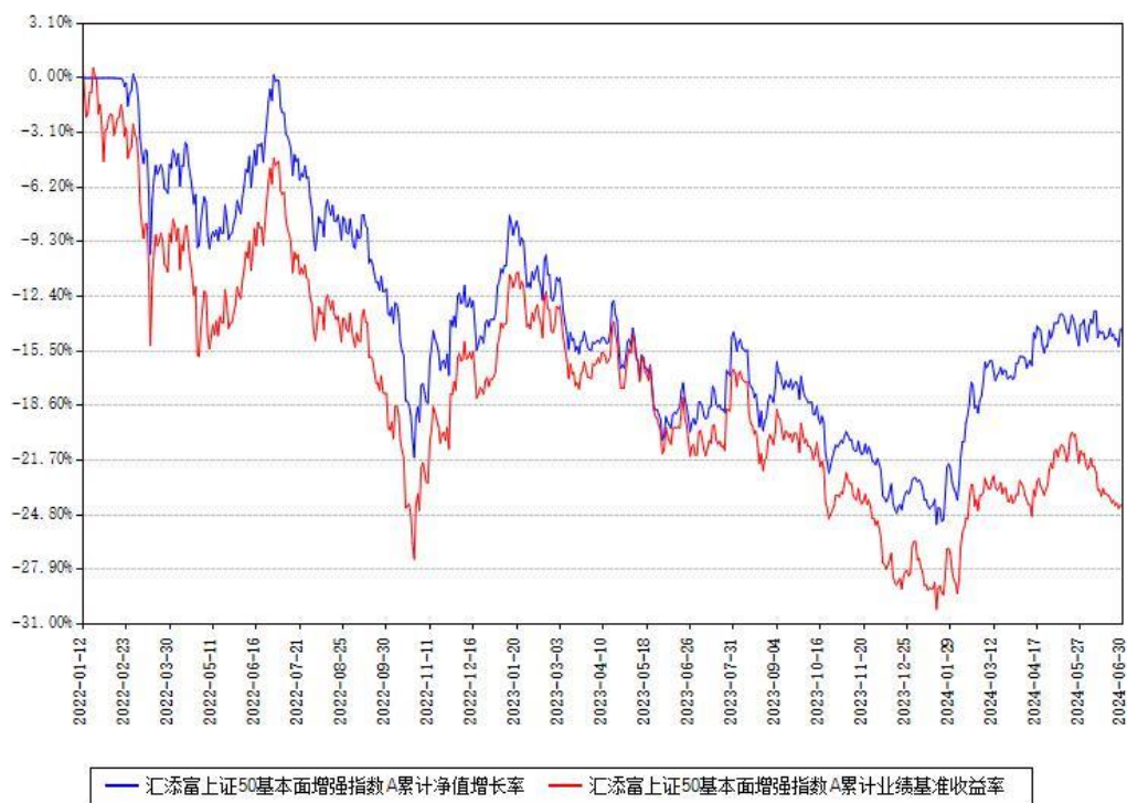
汇添富上证50基本面增强指数A累计净值增长率与同期业绩基准收益率对比图