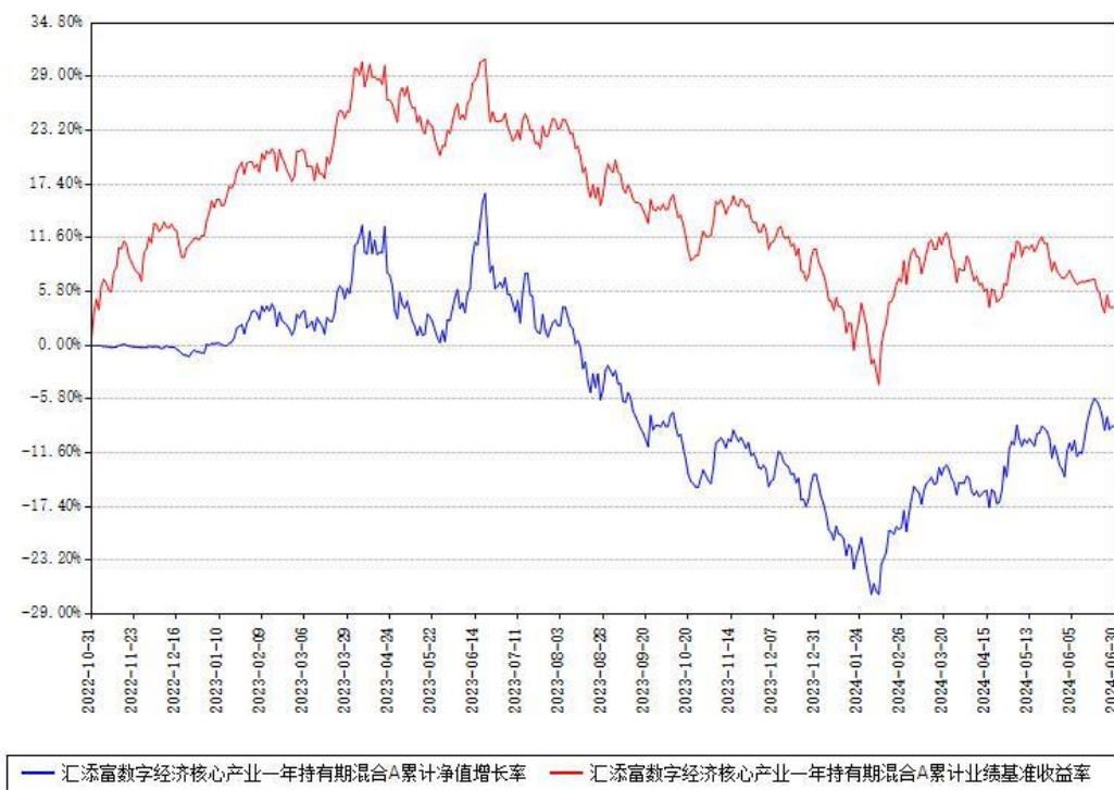
汇添富数字经济核心产业一年持有期混合A累计净值增长率与同期业绩基准收益率对比图