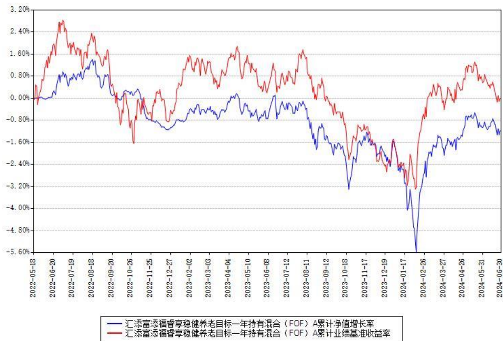
汇添富添福睿享稳健养老目标一年持有混合（FOF）Y 累计净值增长率与同期业绩基准收益率对比图