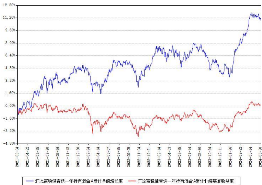
汇添富稳健睿选一年持有混合A累计净值增长率与同期业绩比较基准收益率对比图