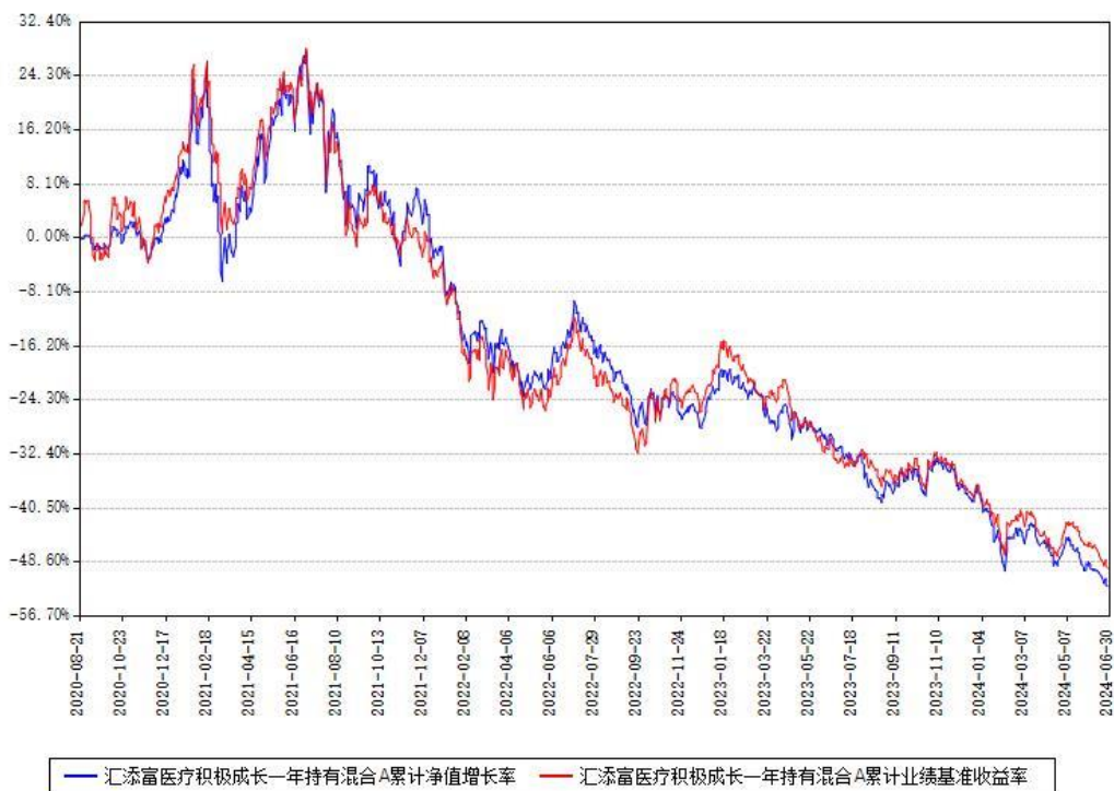
汇添富医疗积极成长一年持有混合A累计净值增长率与同期业绩比较基准收益率对比图