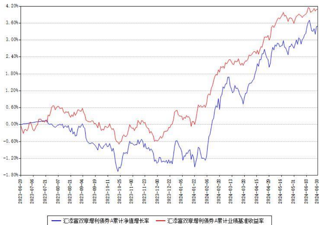
汇添富双享增利债券A累计净值增长率与同期业绩比较基准收益率对比图