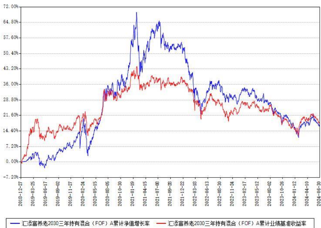
汇添富养老2030三年持有混合 (FOF) A累计净值增长率与同期业绩比较基准收益率对比图