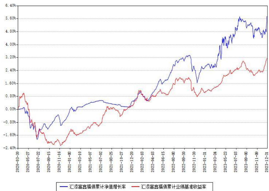
汇添富鑫福债累计净值增长率与同期业绩基准收益率对比图