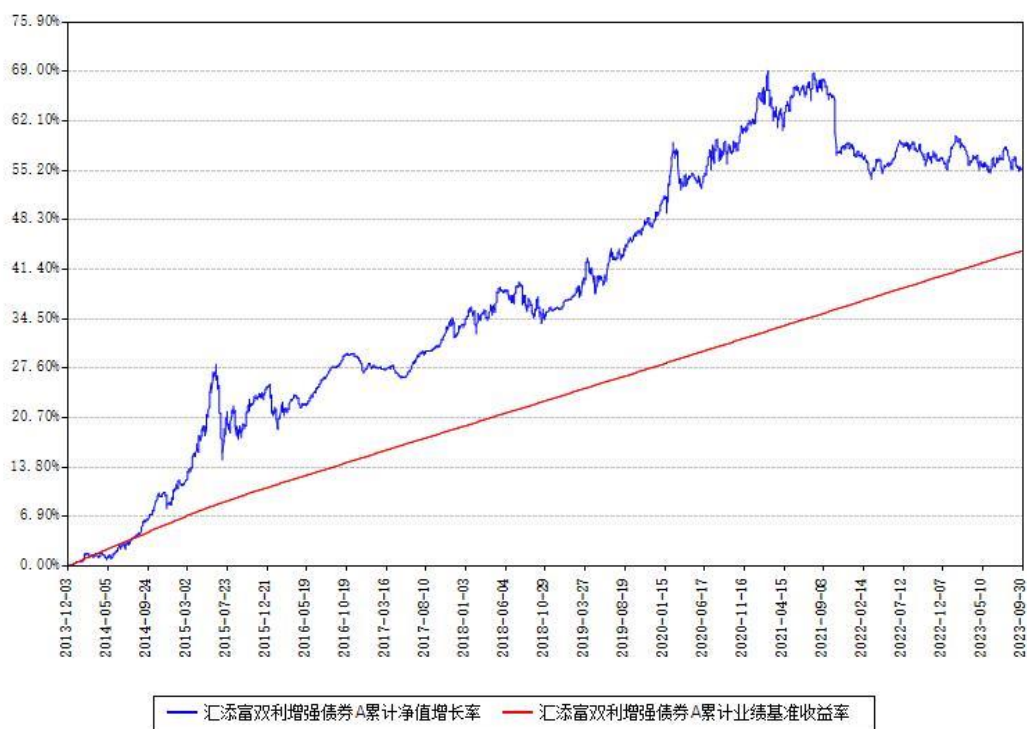
汇添富双利增强债券A累计净值增长率与同期业绩基准收益率对比图