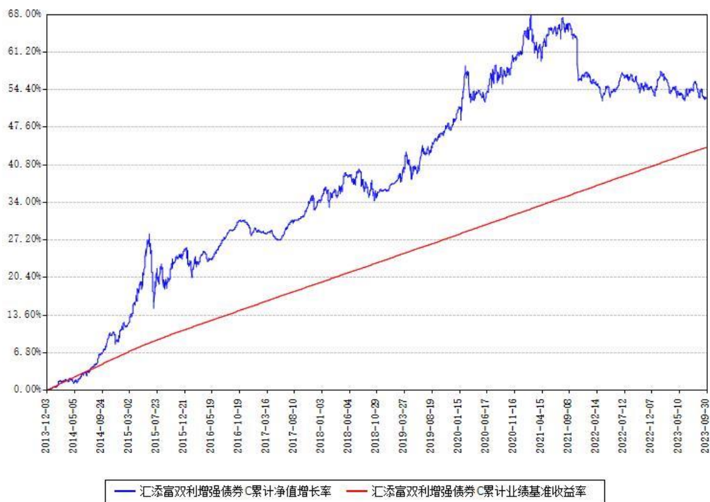
汇添富双利增强债券C累计净值增长率与同期业绩基准收益率对比图