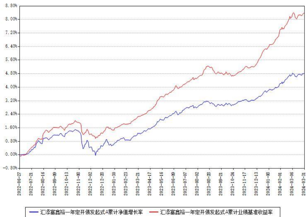
汇添富鑫裕一年定开债发起式A累计净值增长率与同期业绩基准收益率对比图